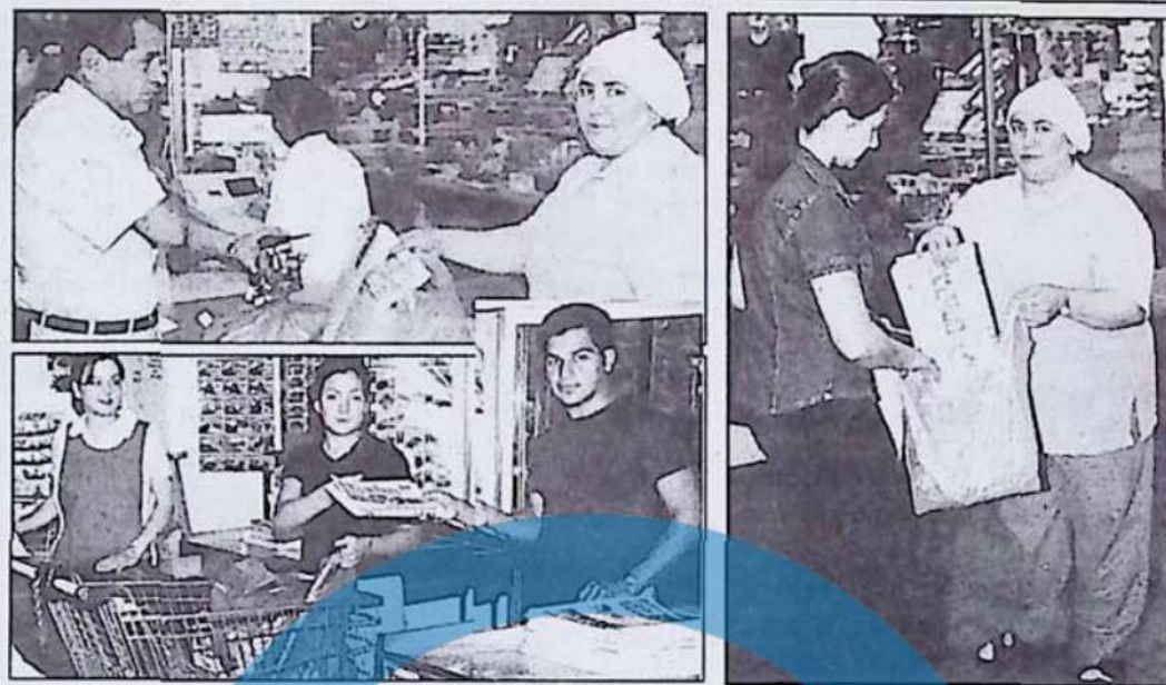
Toplum, her ay başı bugüne kadar görülebilen her yerde okuyucusu ile buluşuyor. Özellikle market ve bakkalların büyük çoğunluğunda gazetemiz alışveriş torbasıyla birlikte okuyucularımızın evine giriyor. Toplum'u arşivleyenleri duydukça, doğru bilginin ne denli önemli olduğu görülmüş oluyor.

Herkesin yönlendirici öneri ve eleştirilerini bekliyoruz.